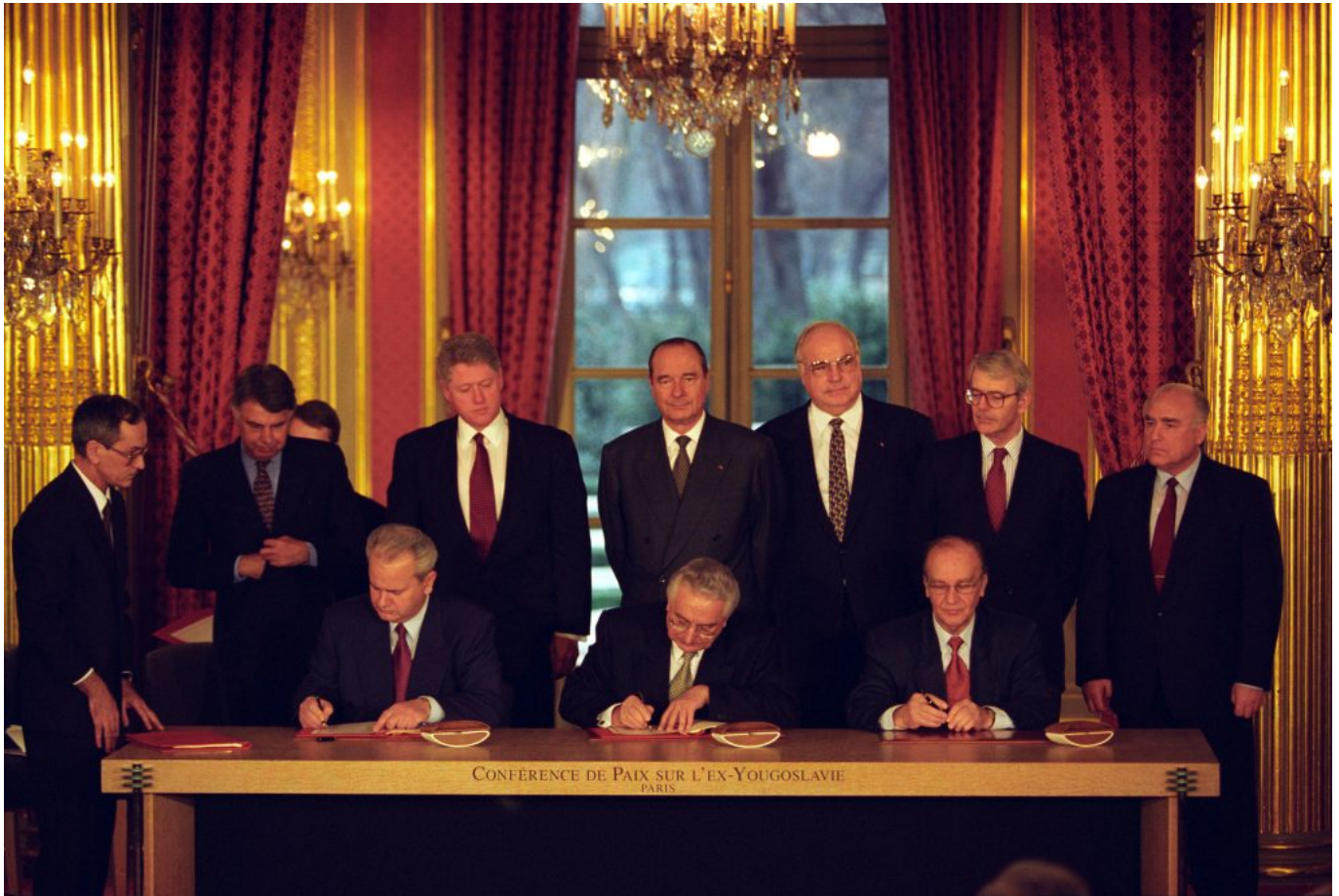
Abbildung 3: Der serbische Präsident Slobodan Milosevic, der bosnische Präsident Alija Izetbegovic und der kroatische Präsident Franjo Tudjman unterzeichnen den Friedensvertrag von Dayton in Paris, 14. Dezember 1995.

Mit dem Zerfall des sozialistischen Jugoslawiens 1991 erlebte das Land einen fatalen Bürgerkrieg, welcher erst 1995 durch den Friedensvertrag in Dayton beendet wurde.