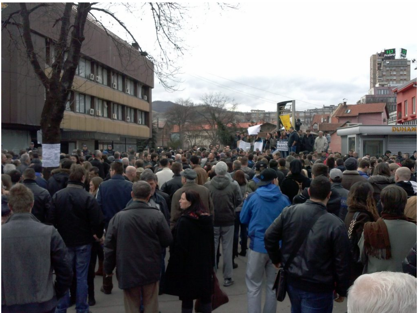
Abbildung 4: Menschen protestieren in Zenica, 10. Februar 2014

Die Proteste in Tuzla mobilisierten Studenten, Rentner, Kriegsveteranen und Arbeitslose in vielen anderen Städten. Dieses Ereignis wurde als die erste reale Gelegenheit angesehen, das Paradigma des Nationalismus zu durchbrechen. Die alltäglichen Probleme Bosniens, d.h. der aufgeblasene Staatsapparat, die Korruption und das dysfunktionale Wirtschaftssystem betreffen alle Bürgerinnen und Bürger in gleicher Manier, unabhängig ihrer religiösen Zugehörigkeit. Dies lässt sich vor allem aus der Rhetorik und aus den Aktivitäten der Protestierenden schliessen, welche sich klar von allen bestehenden Parteien abgrenzten, keine internationale Organisation um Unterstützung baten und basisdemokratische Plenen einrichteten.