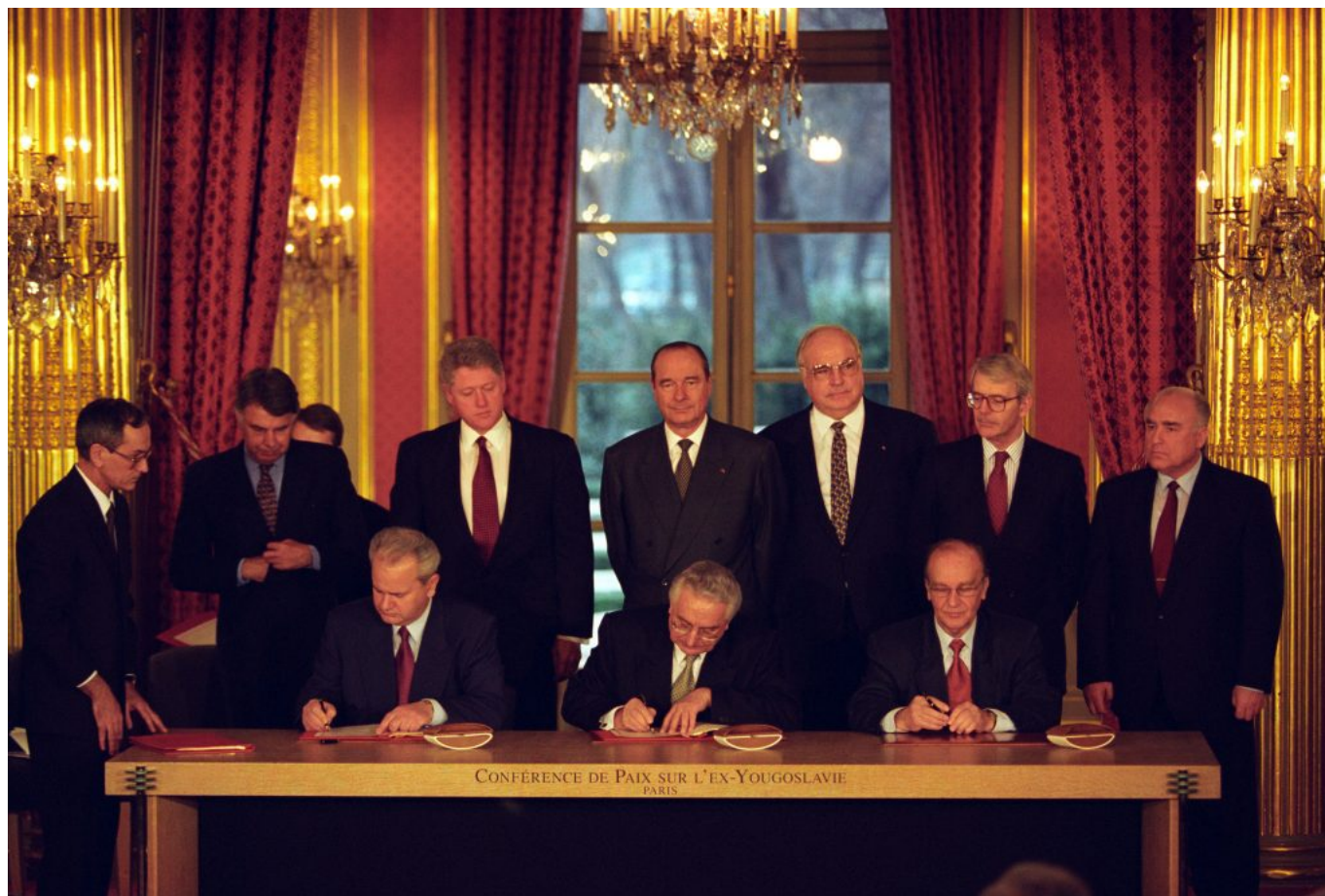
Ilustracija 3: Predsednik Srbije Slobodan Milošević, predsednik Predsedništva BiH, Alija Izetbegović i predsednik Hrvatske, Franjo Tuđman potpisali Dejtonski mirovni sporazum u Parizu, 14.12.1995.