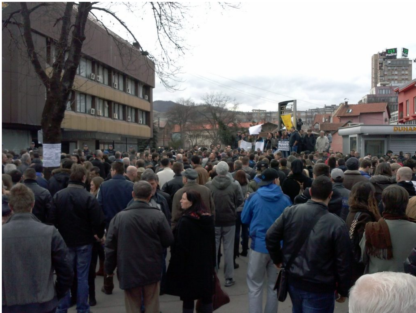
Ilustracija 4: Protesti u Zenici, 10. Februar 2014

Uprkos masovnim mitinzima pokret se u granicama proširio na Republiku Srpsku. U Banja Luci su se održale pojedinačne demonstracije. Masovniji odziv i neka velika pomoć od strane radnika iz Republike Srpske izostaje. Razlozi su bili: represija, difamirung (stvaranje loše reputacije - klevetanje), skandalizovanje od strane etničkobirokratske ekonomske elite, medija i akademije u Republici Srpskoj.□