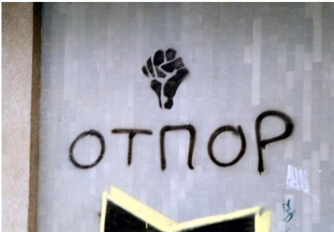
Ilustracija 2: Simbol Otpora, pesnica, kod fakultetske zgrade u Novom Sadu u Srbiji, 2001

značajano su doprinijele da se pokrenu birači tokom izbora 2000ite godine (izbor učesnika u 2000itoj godini iznosio je 71% u odnosu na 48% u 1997 godini). S obzirom da Milošević poraz na izborima nije htio da prihvati, dolazi u cijeloj zemlji do masovnih demonstracija, što je na kraju krajeva značilo završetak Miloševićevog autoritarnog vladanja.□